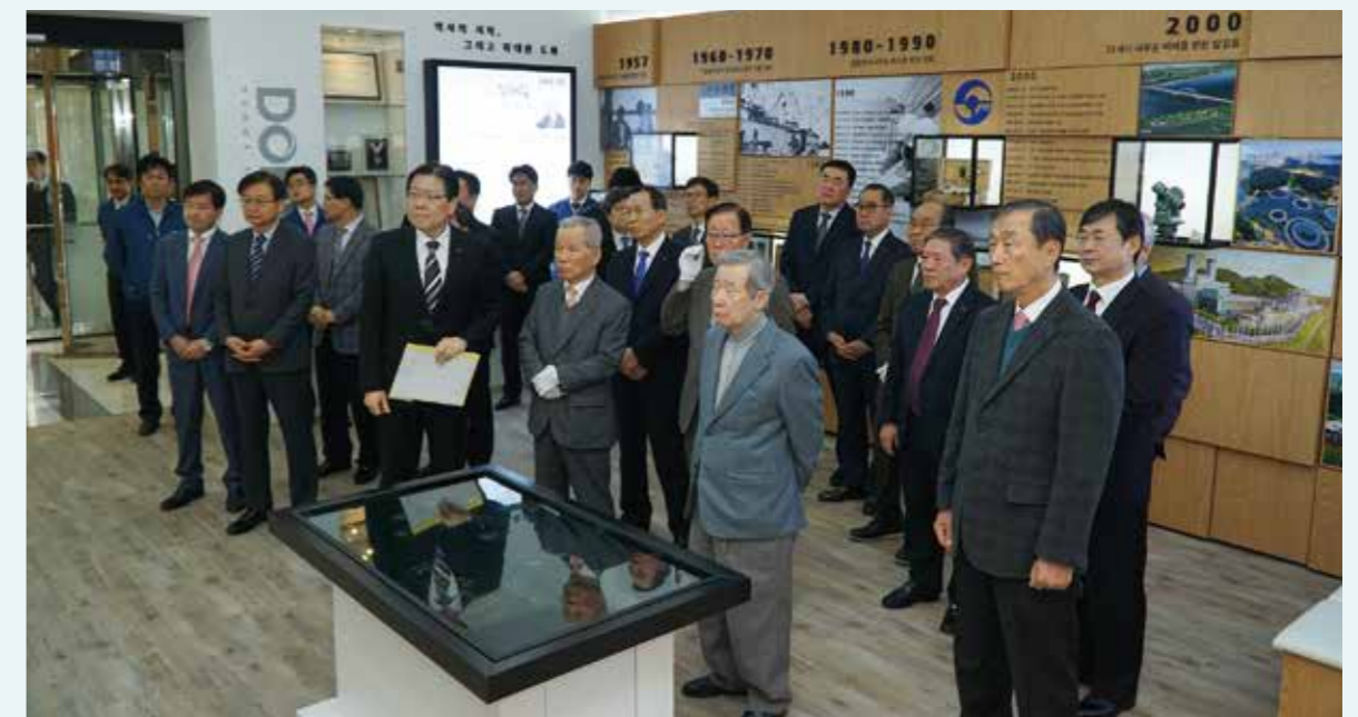
▲ 60주년 역사관 개관식

또한, 도화엔지니어링은 2010년 유가증권시장(KOSPI)에 상장한 뒤, 2011년 지금의 도화엔지니어링으로 사명을 변경하고, 2015년에는 '뉴 비전 2020'을 선포하며 전 임직원이 지켜야 할 핵심가치, 미션 그리고 비전을 재정립하고 국내 1위에서 세계 톱 랭크 업체로 도약해 나가고 있다.